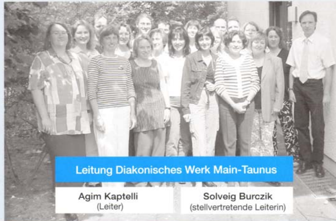
Leitung Diakonisches Werk Main-Taunus